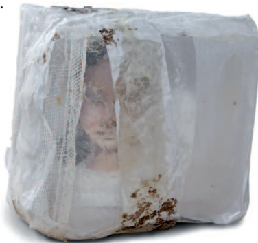
Gisela Tschauner: Kennen wir uns? Acryl auf Leinwand, Folie, Gaze, Papier, 2009, 10 x 10 x 8–12 cm

Unter dem Titel „GesichtZeigen“ geht das Käthe Kollwitz Museum Köln mit der GEDOK KÖLN den verschiedenen Facetten und Selbstbefragungen des Portraits anhand von neunundzwanzig künstlerischen Statements nach. Entstanden ist eine überaus eindrucksvolle Schau der unterschiedlichsten künstlerischen Gattungen: Zeichnung, Malerei, Skulptur, Fotografie, Video und Installation. Die Künstlerinnen haben sich intensiv mit dem Portraitwerk von Käthe Kollwitz auseinander gesetzt – in Selbstportraits, mit Darstellungen anderer Personen oder ganz abstrakt, immer davon ausgehend, dass sich in Gesicht und Körperhaltung eines Menschen Emotionen, Charakter und soziale Einbindung oder Isolation ausdrücken – also ganz im Sinne von Käthe Kollwitz. Kunsthistorisch ist das Portrait eine klar definierte Bildgattung, die sich jedoch über die Jahrhunderte hinweg inhaltlich und formal den Funktionen und erwünschten Bildaussagen angepasst hat. Seit dem 19. Jahrhundert hat die Fotografie als Darstellungsmedium die Portraitmalerei er-