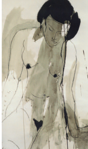
Ingrid Scheller: Aktzeichnung A6 Chinesische Tusche, Kohle auf Papier, 2001, 92 x 53 cm

Unter dem Titel „GesichtZeigen“ geht das Käthe Kollwitz Museum Köln mit der GEDOK KÖLN den verschiedenen Facetten und Selbstbefragungen des Portraits anhand von neunundzwanzig künstlerischen Statements nach. Entstanden ist eine überaus eindrucksvolle Schau der unterschiedlichsten künstlerischen Gattungen: Zeichnung, Malerei, Skulptur, Fotografie, Video und Installation. Die Künstlerinnen haben sich intensiv mit dem Portraitwerk von Käthe Kollwitz auseinander gesetzt – in Selbstportraits, mit Darstellungen anderer Personen oder ganz abstrakt, immer davon ausgehend, dass sich in Gesicht und Körperhaltung eines Menschen Emotionen, Charakter und soziale Einbindung oder Isolation ausdrücken – also ganz im Sinne von Käthe Kollwitz. Kunsthistorisch ist das Portrait eine klar definierte Bildgattung, die sich jedoch über die Jahrhunderte hinweg inhaltlich und formal den Funktionen und erwünschten Bildaussagen angepasst hat. Seit dem 19. Jahrhundert hat die Fotografie als Darstellungsmedium die Portraitmalerei er-