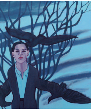
Tremezza von Brentano: Mit Vögeln Öl auf Leinwand, 2011, 130 x 110 cm

Unter dem Titel „GesichtZeigen“ geht das Käthe Kollwitz Museum Köln mit der GEDOK KÖLN den verschiedenen Facetten und Selbstbefragungen des Portraits anhand von neunundzwanzig künstlerischen Statements nach. Entstanden ist eine überaus eindrucksvolle Schau der unterschiedlichsten künstlerischen Gattungen: Zeichnung, Malerei, Skulptur, Fotografie, Video und Installation. Die Künstlerinnen haben sich intensiv mit dem Portraitwerk von Käthe Kollwitz auseinander gesetzt – in Selbstportraits, mit Darstellungen anderer Personen oder ganz abstrakt, immer davon ausgehend, dass sich in Gesicht und Körperhaltung eines Menschen Emotionen, Charakter und soziale Einbindung oder Isolation ausdrücken – also ganz im Sinne von Käthe Kollwitz. Kunsthistorisch ist das Portrait eine klar definierte Bildgattung, die sich jedoch über die Jahrhunderte hinweg inhaltlich und formal den Funktionen und erwünschten Bildaussagen angepasst hat. Seit dem 19. Jahrhundert hat die Fotografie als Darstellungsmedium die Portraitmalerei er-